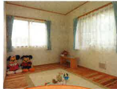
省エネルギー対策